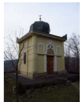
Das Blaue Häusel