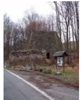
Der Kalkofen an der Winterleite