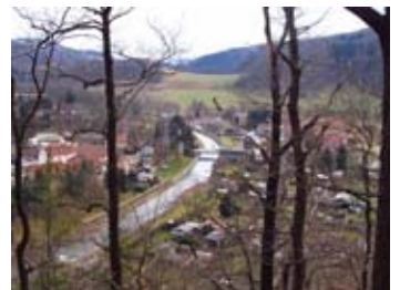
Blick ins Müglitztal

Es ist ein eisig kalter Januarmorgen. 21 Wanderfreunde und ein Hund treffen sich am Bahnhof Niedersedlitz . Völlige Verwirrung herrscht wie immer, als es darum geht, mit welcher Fahrkarte man heute durch den Tag kommt und mit wem man sich eine solche teilen kann. Damit die Erinnerung an getroffene Absprachen länger als 5 Minuten anhält, werden die sich spontan bildenden Kleingruppen sofort äußerlich gekennzeichnet. Viel Zeit für diese Dinge bleibt uns nicht, denn schon 9:10 Uhr fährt unsere S-Bahn in Richtung Bad Schandau ab. Wir fahren zunächst bis Heidenau . Dort leert sich die S-Bahn, denn jede Menge Wintersportler wollen wie wir in den Zug nach Altenberg umsteigen. Dieser ist dann auch gut gefüllt. In Mühlbach verlassen wir den Zug und sammeln uns auf dem Bahnsteig. Jetzt geht's los!