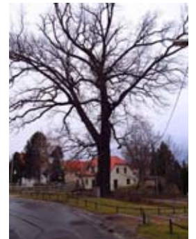
Die Luthereiche von Kleinluga