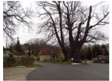
Die Schmorsdorfer Linde

Mit nunmehr fast leerem Gepäck gehen wir wieder zur Straße und erreichen auf ihr wenig später das Dorf Sürßen . An der Kreuzung im Ort biegen wir links ab. Die Straße führt uns nun geradewegs in den Nachbarort Gorknitz . Diesen durchqueren wir geradeaus. In einer Kurve hinter dem Ort kreuzt ein Bach die Straße. Entlang des Bächleins führt ein Wanderweg nach rechts. Die Rietzschke begleitet uns nun für etwa einen Kilometer bis zur nächsten Straße. Dort halten wir uns links und gleich danach wieder rechts. Nur noch wenige Meter und wir befinden uns im Gut Gamig . Das alte ehemalige Rittergut ist denkmalgeschützt und hat eine wechselvolle Geschichte hinter sich. Heute beherbergt es eine Rehabilitations- und Begegnungsstätte zur Behandlung psychisch kranker Menschen. Zunächst wenden wir unsere Schritte in Richtung Gutskapelle. Wie an vielen anderen Stellen