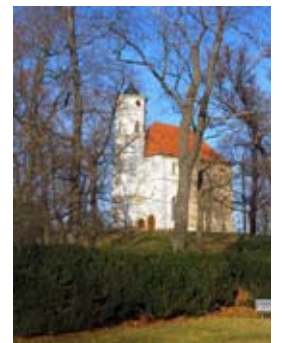
Die Gutskapelle Gamig